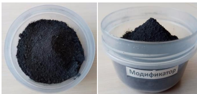
Рисунок 1 – Внешний вид порошкового модификатора

1.1.2 Внешний вид модификатора представлен на рисунке 1.